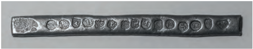
Nadel mit Beschau- und Meisterzeichen der Würzburger Goldschmiedezunft, 2. Hälfte 16. Jahrhundert. Privatarchiv Lockner, Würzburg

Die sog. Nadel ist ein schmaler bandförmiger Streifen aus Blei (Länge 95,8 mm, Breite 8,5 mm, Dicke 2,5 mm). Die Oberseite ist minimal gewölbt, die Kanten sind leicht abgerundet. Die Schmalseiten wurden gerade abgezwickelt. Die flache Unterseite ist nicht bearbeitet. Zur leichteren Handhabung des Stückes wurde die Oberfläche an einer Schmalseite (bei richtiger Positionierung links) ein wenig muldenförmig vertieft, so dass eine Daumenruhe entstand. Dann finden sich nebeneinander aufgereiht 15 verschiedene Zeichen, die gut erkennbar mit Punzen in das Blei eingeschlagen wurden. An erster Stelle steht das Würzburger Beschauzeichen, dann folgen die individuellen Zeichen von 14 Würzburger Goldschmiedemeistern.